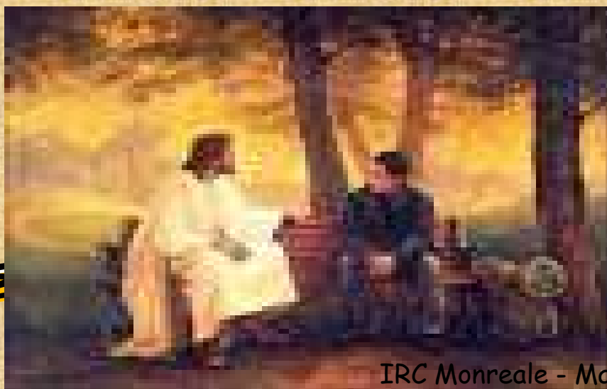
IRC Monreale - Maurizio Muraglia